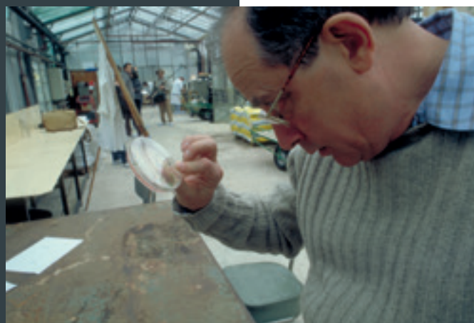
Pose dans les serres de l'Institut Jean-Pierre Bourgin à Versailles, à l'occasion d'un tournage concernant la collection Arabidopsis.