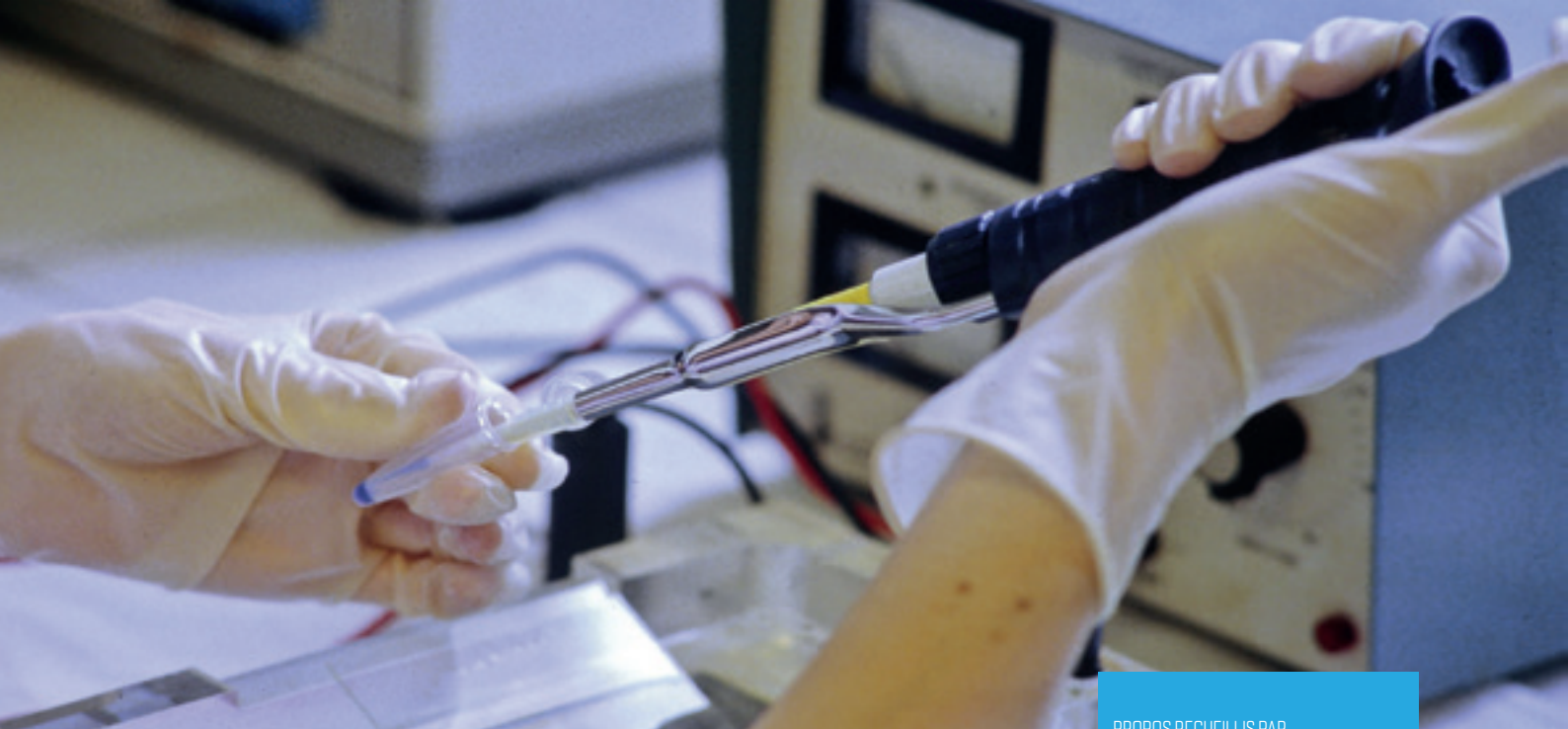
Dépôt pour électrophorèse.

PROPOS RECUEILLIS PAR PASCALE MOLLIER & CHRISTIAN GALANT OCTOBRE 2017