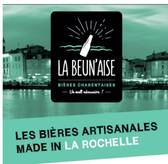
Figure 1 –La Beun’aise et son territoire rochelais