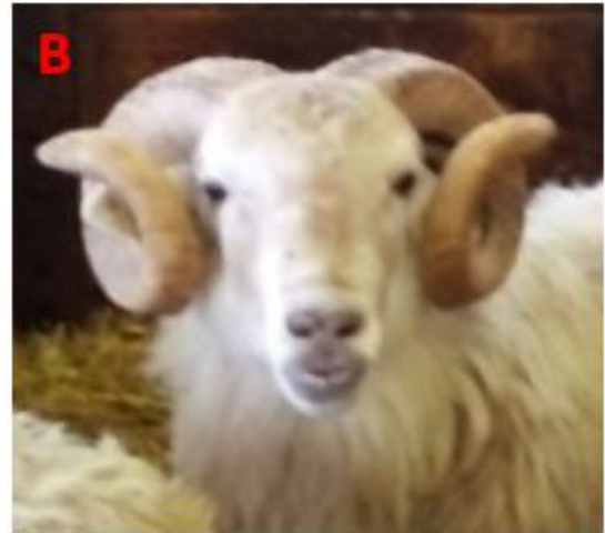
Figure 3. Comparaison de la taille des cornes chez deux races ovines françaises. (A) Noire du Velay (race allaitante), (B) Manech Tête Rousse (race laitière)