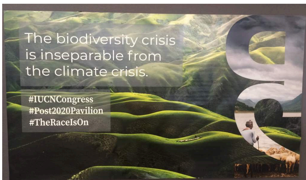
Figure 3. Illustration du rapprochement des enjeux climatique et biodiversité sur l'affiche du pavillon du Partenariat Post-2020 au sein de l'exposition