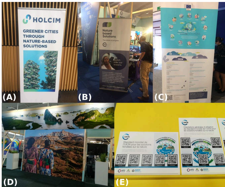
Tableau 3. Les espaces ayant accueilli des événements liés aux SfN au sein de l'exposition