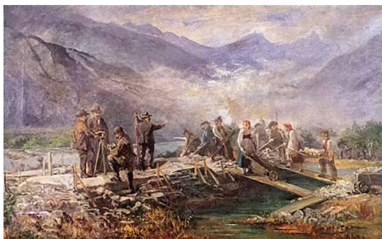
Travaux de correction du Rhône à Rarogne, peinture à l'huile. Raphaël Ritz

Ce nouveau partage strict entre terre et eau est défendu par les ingénieurs et la classe politique. Il répond à un paradigme à la fois technique, scientifique et socioculturel : comme on corrige un enfant, on cherche à corriger le comportement du fleuve. En cette fin du XIX e siècle, rares sont les voix qui s'insurgent contre la disparition des forêts et des zones humides à haute valeur écologique.