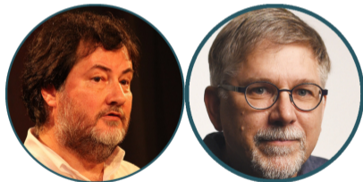
Figure 1: A l'origine du projet R

En 1996, deux chercheurs Ross Ihaka et Robert Gentleman (?@fig-createurs_R) (Ihaka and Gentleman 1996) proposent un nouveau langage pour les analyses statistiques et la production de graphiques se basant sur le langage S et Scheme .