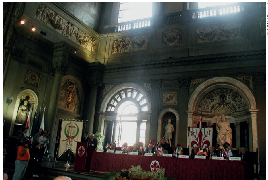
La grande salle du palazzo vecchio à Florence, en 2003, pour le 250 ème anniversaire de l'Accademia dei Georgofili.