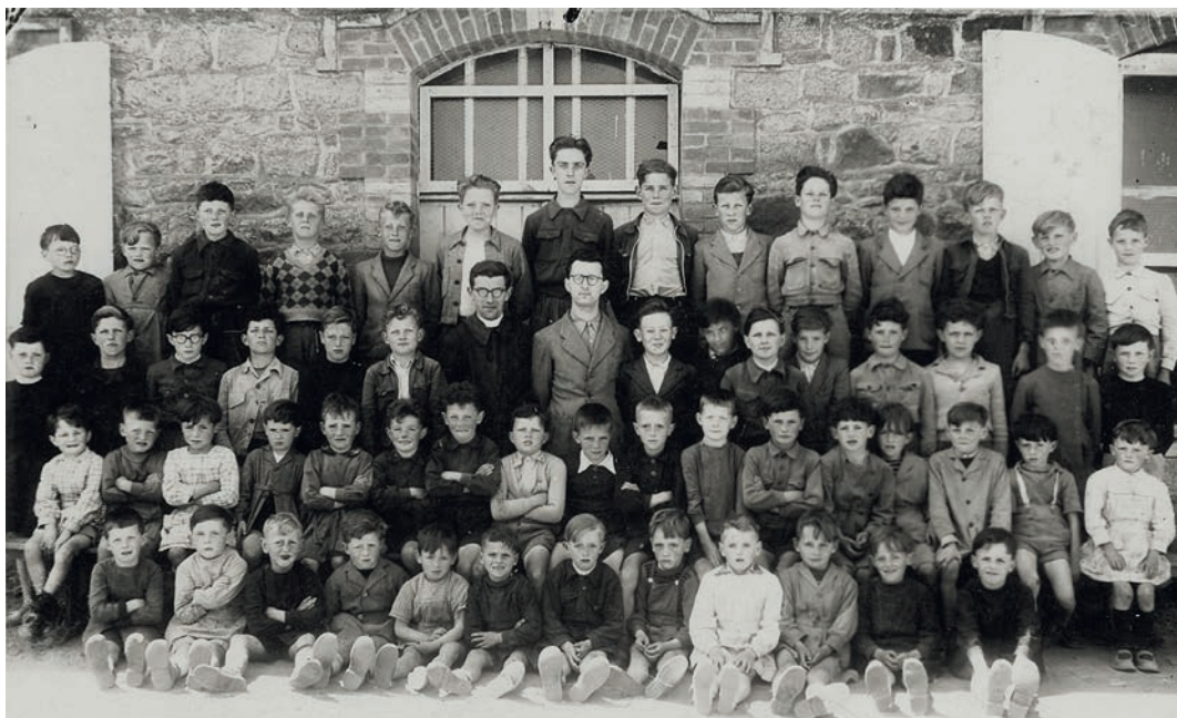
À l'école primaire de Trégueux (Côtes du Nord jusqu'en 1990, aujourd'hui Côtes d'Armor) en 1955.

parfois subis déjà avec lassitude, mais la rareté des divertissements faisait des fêtes et pardons une distraction conviviale et attrayante à cet âge, surtout quand l'événement migrifait vers les chapelles dispersées au creux de la campagne. La Fête-Dieu était une occasion de partir à la cueillette des fleurs printanières dont l'abondance et la diversité m'ont laissé le souvenir d'un charme émouvant qui contraste avec la banalité, uniforme et sans fleurs, d'une grande partie de la campagne bretonne d'aujourd'hui. Je dois encore à ce vicaire-instituteur les randonnées à vélo, parcourant la Bretagne, de cures en monastères, et à la petite adolescence les premiers grands voyages en combi Volkswagen, visitant les sites du sud de la France pour revenir par le Palais de la Découverte à Paris dont la cage de Faraday me laissa une forte impression.