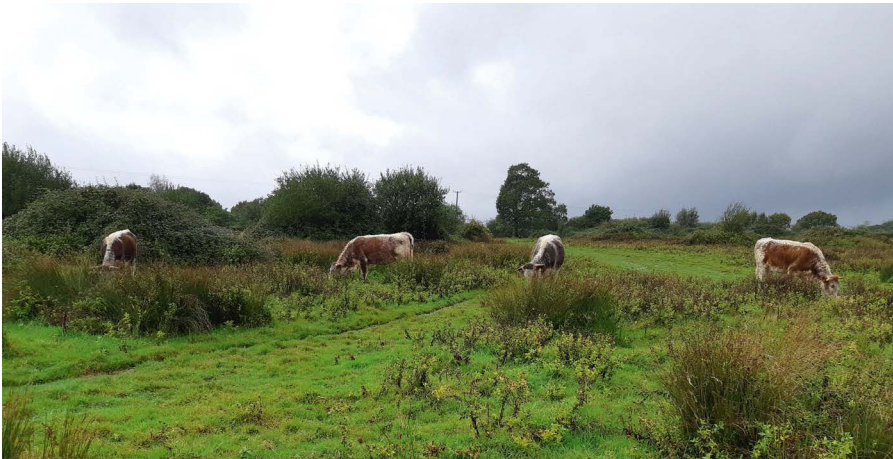
Figure 2. Vaches Long-horn à la ferme Knepp.