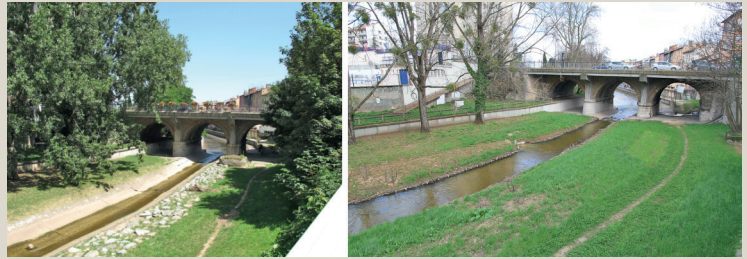
Figure 3 – Travaux de génie végétal sur l'Yzeron.

Les résultats des photo-questionnaires et des relevés écologiques (figure 3) montrent qu'il existe des bénéfices variés sur les plans écologique (accroissement de la biodiversité, de la connectivité, de l'ombrage) et social (accroissement de la valeur esthétique et, dans une certaine mesure, récréative). Ces bénéfices sont perçus quel que soit le niveau d'expertise environnementale dont disposent les individus (niveau d'expertise basé sur du déclaratif). Le croisement des valeurs écologiques (couverture végétale, connectivité, biodiversité et ombrage) avec les valeurs perçues (esthétique, récréative et sentiment de vulnérabilité) montre que, prises deux à deux, toutes sont significativement positivement corrélées. Ainsi, la valeur esthétique des ouvrages augmente avec leur couverture végétale, avec la connectivité au paysage environnant (et donc avec la présence d'arbres aux alentours), avec la biodiversité (le nombre d'espèces végétales présentes) ou avec l'ombrage apporté par le couvert végétal. La valeur récréative est également corrélée positivement à ces quatre variables. En revanche, on note qu'au-delà d'une certaine densité de végétation, cette valeur tend à rediminuer. Le sentiment de vulnérabilité s'accroît quant à lui significativement avec le gradient de végétation.