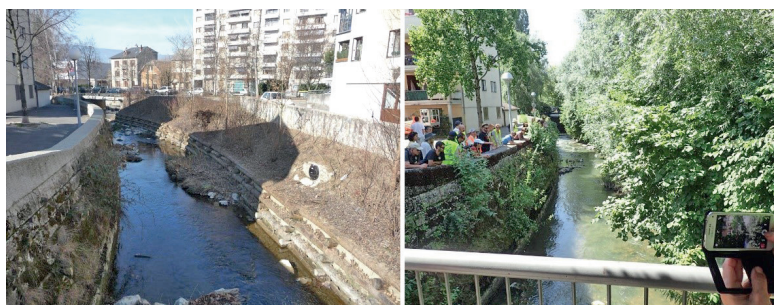
Figure 2 – Protection de berge avec un caisson végétalisé sur l'Albanne à Chambéry (en 2011, puis en 2016).

Ainsi, selon les gestionnaires interrogés, l'évaluation de la performance uniquement centrée sur la lutte contre l'érosion à court terme et à une échelle très localisée minimise les avantages du génie végétal sur le long terme, à l'échelle du cours d'eau dans son ensemble, ainsi que les bénéfices écologiques et sociaux. Il en résulte une situation paradoxale : la valeur écologique et sociale des berges végétalisées fait consensus, mais peu d'évaluations sont conduites sur le terrain pour le démontrer. Ce constat peut être illustré par le commentaire suivant d'un gestionnaire : « Le suivi, dans la gestion des milieux aquatiques, c'est un peu le parent