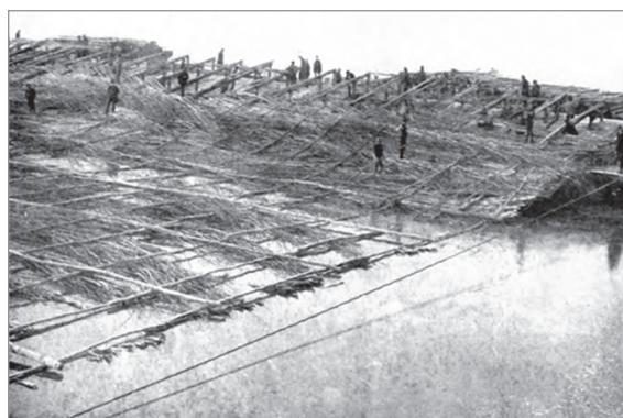
Figure 1 – Tissage d'un tapis subaquatique sur les berges du Mississippi à la fin du XIX e siècle (US Army, 1922).

1. Union internationale pour la conservation de la nature.