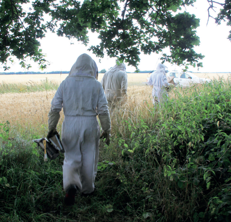
Apiculteurs en Ile-de-France. Photo © Charlotte CHIARELLI, août 2019.

En accédant au rang de sentinelle de la biodiversité, l'abeille, et dans son sillage l'apiculture ont contribué à mettre en exergue les rapports complexes entre agriculture et environnement, du fait notamment des pratiques délétères de l'agriculture productiviste pour les abeilles, et pour la biodiversité en général. Elles ont dans le même temps suscité de nouvelles pratiques attentives à la sauvegarde et au bien-être des abeilles, y compris chez les professionnels, dénonçant tour à tour l'excès de nourrissage, le brassage et la sélection génétique responsables de la perte de biodiversité et de la rusticité des abeilles. De son côté, le ministère de l'Agriculture a tenu à réaffirmer son influence et sa prééminence sur l'apiculture en arguant de la nécessité d'organiser la filière apicole et de développer sa professionnalisation comme le prévoient le rapport Saddier (2008) puis le Plan de Développement durable de l'Apiculture (GESTER, 2012). Ces