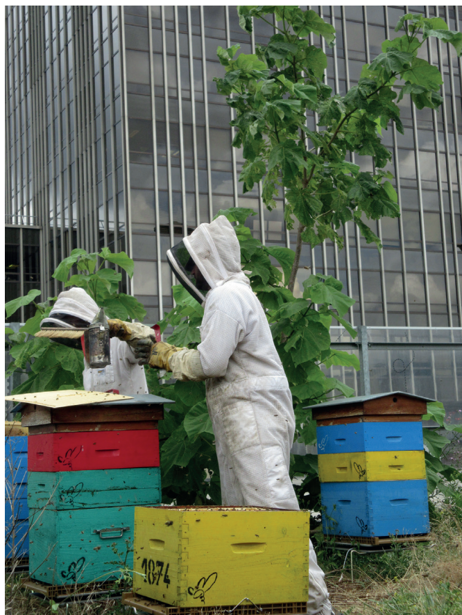
Apiculture urbaine, Paris.