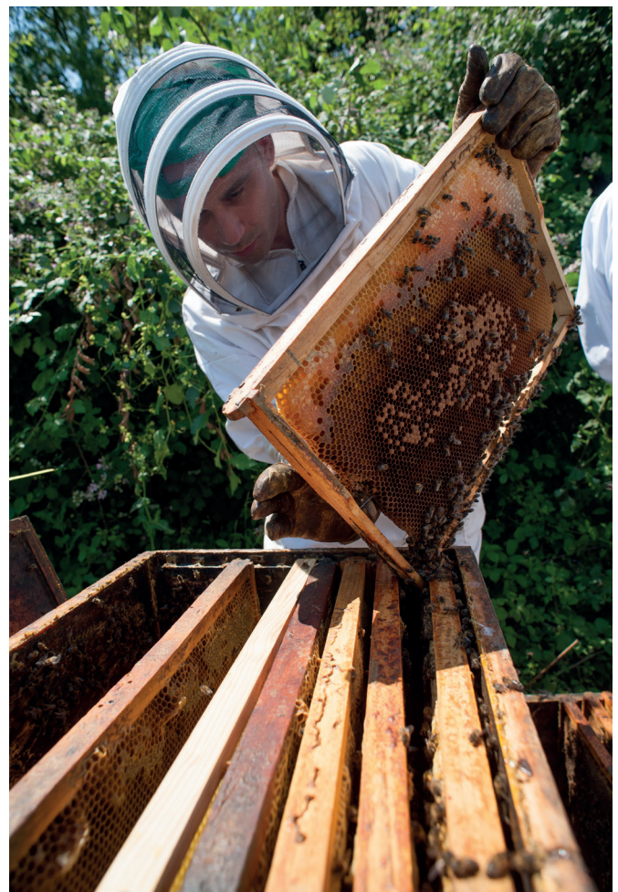
Ruche à cadres mobiles