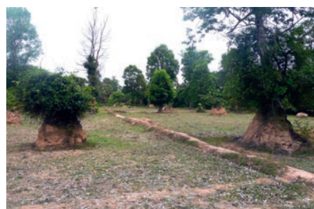
▲ Buttes termitiques recouvertes de végétation apparaissant comme des îlots de fertilité et de biodiversité dans les rizières. Cambodge, 2007.

néanmoins dans leur capacité à produire des termitières ou buttes termitiques structurant les paysages agricoles en Asie du Sud-Est qui, en hébergeant une faune et une flore spécifique (4) , apparaissent comme des îlots de fertilité et de biodiversité dans les agrosystèmes, fournissant une diversité de services écosystémiques tels que constituer un refuge pour la biodiversité, améliorer la productivité végétale et contribuer à la diversité alimentaire ou la santé des populations locales.