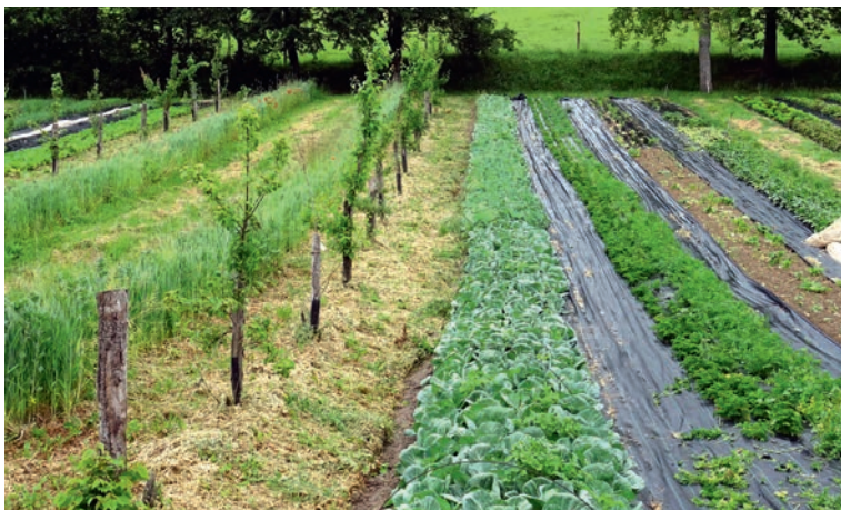
▲ Un exemple de verger-maraîcher, système associant arbres fruitiers et cultures maraîchères, dans le sud de la France.

• Paut R., Sabatier R., Tchamitchian M., 2019. Reducing risk through crop diversification: an application of portfolio theory to diversified horticultural systems. Agric. Syst. 168: 123-130. https://doi.org/10.1016/j.agsy.2018.11.002