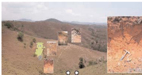
Paysage de collines convexes associant des sols bruns acides à fersiallitiques et des sols fersiallitiques lessivés

La géomorphologie et les grands paysages sont définis à partir de critères géologiques, paramètre le plus stable dans le temps. Ils conditionnent en majeure partie l'évolution des formes et des modelés. L'île de la Grande Terre réunit en effet un ensemble diversifié de formes à l'image de l'histoire géologique ancienne et complexe de cette unité.