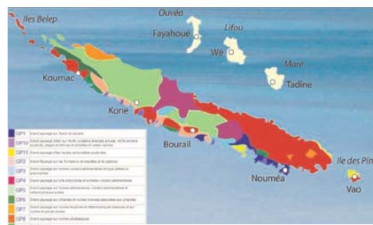
Carte des 14 grands paysages pédologiques de Nouvelle Calédonie

Le travail morpho-pédologique à partir de la carte de synthèse à 1/200 000 est organisé en 13 grands paysages et 44 paysages. Des détails sont illustrés à partir d'une carte à 1/50 000. L'interface web permet d'accéder