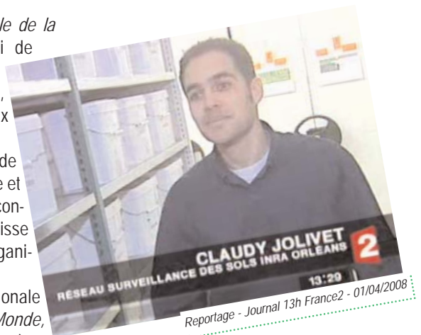
Reportage - Journal 13h France2 - 01/04/2008

tions, l'urbanisation sont ainsi régulièrement évoqués lorsque le RMQS est initialement décrit.