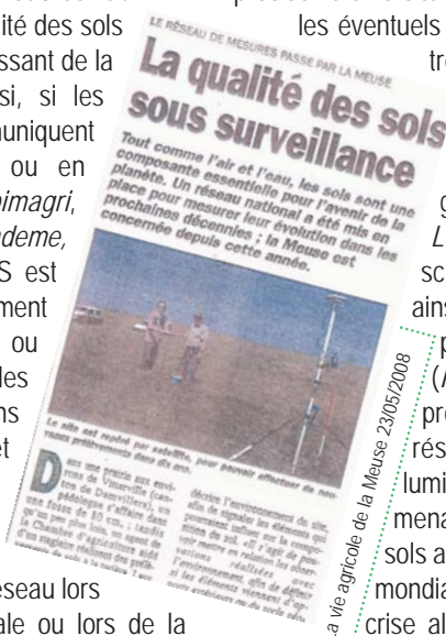
La vie agricole de la Meuse 23/05/2008

La presse nationale généraliste ( Le Monde, Les Echos, Le Figaro ) ou scientifique ( Science et Vie ) ainsi que les médias radiophonique ou télévisés ( France 2-3, Radio France ) profitent généralement du réseau pour mettre en lumière les fonctions et les menaces qui pèsent sur les sols au niveau national et même mondial. Les liens du sol avec la crise alimentaire, le changement climatique, la santé des popula-