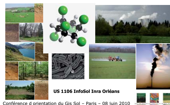
Conférence d'orientation du Gis Sol - Paris - 08 juin 2010