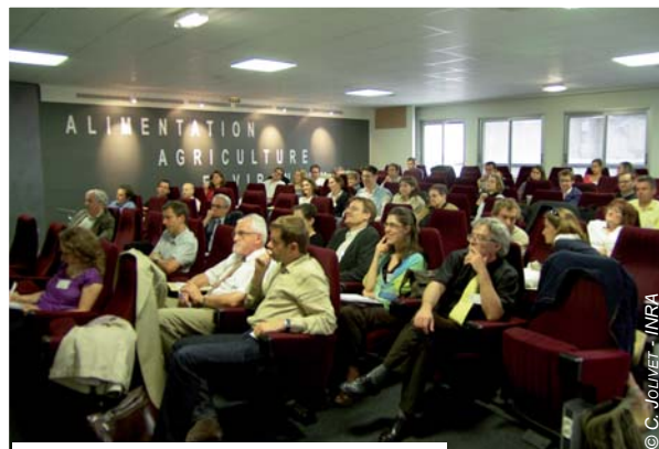
Les participants à la Conférence d'orientation du Gis Sol

L'ensemble de ces programmes a pu être valorisé, en particulier dans le cadre de demandes institutionnelles nationales : zonages des risques d'érosion, contribution à la détermination du "bruit de fond" en éléments traces métalliques, délimitation des zones humides, révision des critères de délimitation des zones défavorisées simples, contribution des sols au bilan de gaz à effet de serre, etc. Les applications régionales du programme