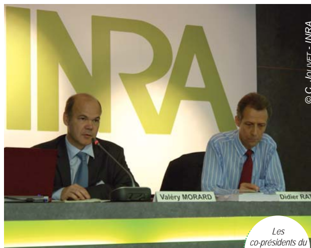
Les co-présidents du Gis Sol

Pour finir, la restitution des ateliers a été suivie d'une discussion générale et d'une synthèse montrant l'intérêt porté aux programmes du Gis Sol et les voies d'exploration possibles. Les propositions énoncées portent notamment sur : l'acquisition de nouvelles analyses (arsenic, mercure, microorganismes, radionucléides, polluants organiques persistants, éléments traces biodisponibles) ou de nouveaux indicateurs (biodiversité, tassement), la capitalisation et le partage d'expériences et le lien avec d'autres thématiques (urbanisme, gaz à effet de serre, toxicité et bioaccumulation).