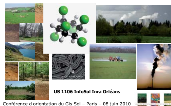
Conférence d'orientation du Gis Sol - Paris - 08 juin 2010