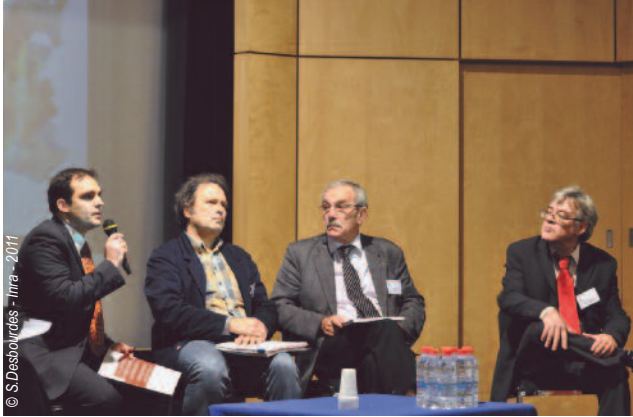
Les experts du Gis Sol rassemblés pour répondre aux questions

L e débat initié par la table-ronde s'est poursuivi par les questions de la salle aux experts du Gis Sol. La variété des thèmes abordés (urbanisme, biodiversité, épandage de déchets, contamination...) montre à quel point le sol est au cœur de nombre d'enjeux.