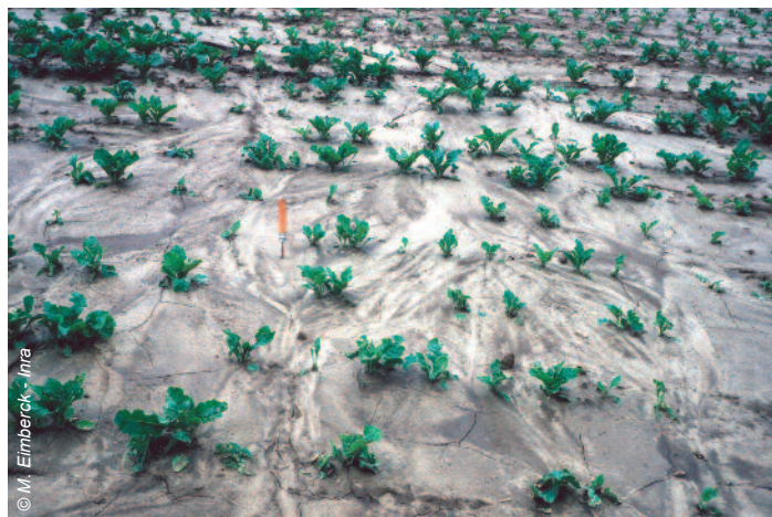
Formation d'une croûte de battance sur des sols limoneux sous culture de betterave

Malgré les connaissances acquises grâce à ces travaux, de nombreuses incertitudes et interrogations subsistent. Elles portent par