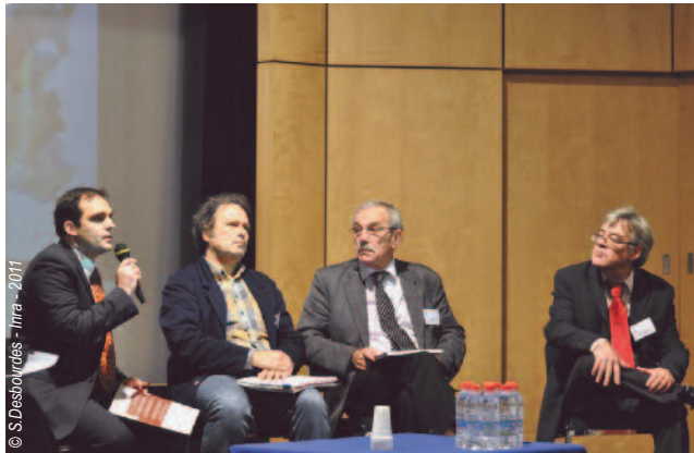
Les experts du Gis Sol rassemblés pour répondre aux questions

L e débat initié par la table-ronde s'est poursuivi par les questions de la salle aux experts du Gis Sol. La variété des thèmes abordés (urbanisme, biodiversité, épandage de déchets, contamination...) montre à quel point le sol est au cœur de nombre d'enjeux.