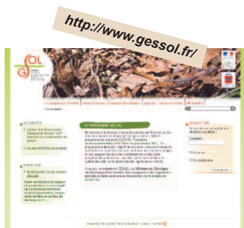
Le site internet du Programme GESSOL

Le site web présente le programme (objectifs, historique, publications) et les différents projets de recherche financés (résumés et rapports finaux), mais aussi des informations sur les actualités relatives aux sols (événements, nouvelles publications) ainsi que des dossiers thématiques grand public pour mieux connaître les sols et leur importance. N'hésitez pas à nous faire part de vos événements et publications pour faire vivre ce site.