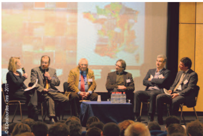
Les participants à la table ronde

Ce rapport du Gis Sol est un excellent travail remarqué de manière ostentatoire par la Commission européenne. L'Assemblée permanente des chambres d'agriculture (APCA) va engager un recensement des utilisations et besoins en