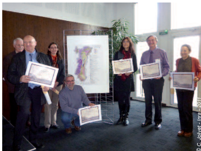
Un RRP reconnu de qualité supérieure

Certaines applications ont concerné l'espace transfrontalier de la vallée du Rhin, caractérisé par un enjeu majeur partagé : la nappe phréatique rhénane, considérée comme la plus importante d'Europe par son ampleur. Ces premières mises en commun de données françaises et allemandes pourraient se développer avec la constitution d'une base de données sols harmonisée, la mise en commun d'une surveillance de la qualité des sols prolongeant le Réseau de mesures de la qualité des sols (RMQS) national déployé dès 2006 en Alsace ou encore le développement de réseaux d'observation sur des questions partagées comme l'évolution des stocks de carbone organique des sols. Ainsi, ces données réunies pourraient alimenter les outils d'analyse territoriale et de prospective fondés sur des modèles agronomiques, en cours de développement. L'échelle de précision des bases de données sol disponibles reste cependant perçue comme une limite à leur appropriation par