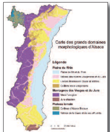
Petits Domaines Morphologiques d'Alsace et délimitation des 10 guides des sols d'Alsace