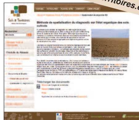
Le site internet du RMT