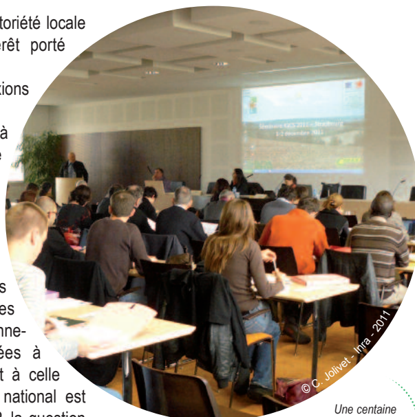
Une centaine de participants attentifs

Les RRP, très riches et complets, mais établis au 1/250 000, restent d'un usage complexe : l'enjeu de leur valorisation rejoint celui de l'élaboration de typologies de sols appliquées,