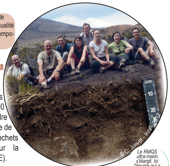
Le RMQS ultra-marin s'élargit. Ici l'équipe qui a participé au RMQS à la Réunion