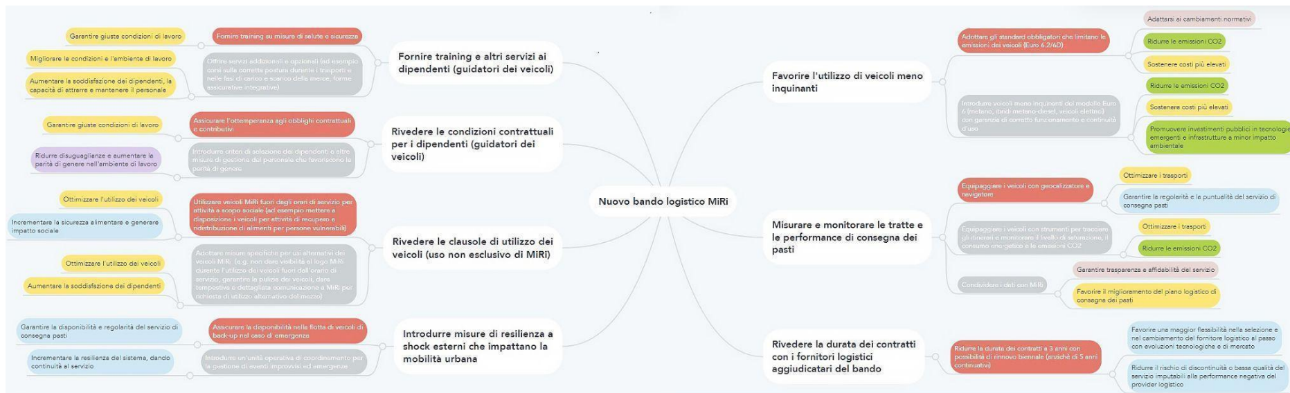
Figura 3 – Mappa dei percorsi d'impatto dell'innovazione di MiRi ( link alla mappa ).