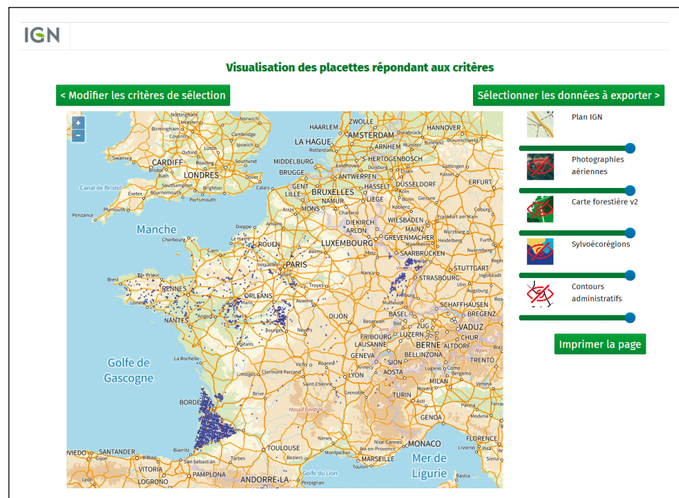
Figure 2: Podzolic plots for the surveys from 2017 to 2021 N.B. : Les coordonnées géographiques fournies sont celles du centre de la maille kilométrique de la grille d'échantillonnage la plus proche du point (les coordonnées exactes de la placette d'échantillonnage se situent à 700 mètres maximum de ce centre).

Figure 2 : Placettes à caractère podzolique pour les campagnes d'inventaire de 2017 à 2021