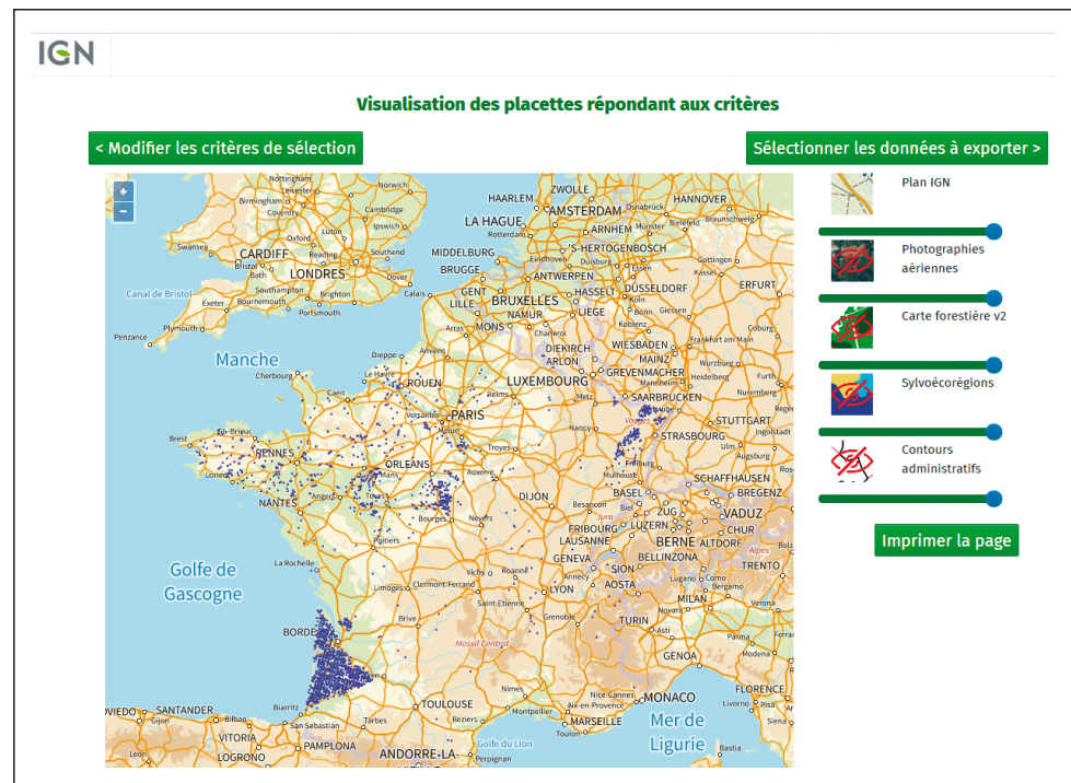
Figure 2: Podzolic plots for the surveys from 2017 to 2021 N.B. : Les coordonnées géographiques fournies sont celles du centre de la maille kilométrique de la grille d'échantillonnage la plus proche du point (les coordonnées exactes de la placette d'échantillonnage se situent à 700 mètres maximum de ce centre).

Figure 2 : Placettes à caractère podzolique pour les campagnes d'inventaire de 2017 à 2021