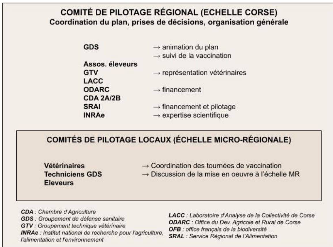
Figure 2 : Gouvernance du Plan Aujeszky

Un nouveau plan émerge alors. Il opère un double changement de stratégie : adopter une approche de pilotage local du dispositif de gestion entre tous les acteurs locaux et vacciner à l'échelle de micro-régions. En effet, le pari est fait que repenser le problème à l'échelle de la micro-région permet de générer des formes d'engagement des acteurs locaux, en particulier des éleveurs, impulsées par d'autres acteurs locaux, les leaders et les têtes de réseau qui jouent un rôle d'incitation et d'enrôlement d'autres participants (Charrier et al., 2020). Afin d'encourager l'engagement des éleveurs et la communication entre les différents acteurs, des comités de pilotage locaux doivent se tenir dans les différentes micro-régions. Un comité de pilotage local rassemblant les différents intervenants (éleveurs locaux, vétérinaires, experts GDS doit se mettre en place dans chaque micro-région, et un comité de pilotage régional regroupant l'ensemble des intervenants impliqués dans le plan (représentants des éleveurs, GDS, INRAE, SRAL, DDETSPP, représentants de l'OFB, fédération de chasse, GTV) doit piloter le plan dans son ensemble, favoriser la participation, la concertation et la prise de décision entre tous ces acteurs (figure 2).