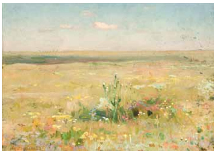
Steppe, Jan Stanislawski (1860-1907)