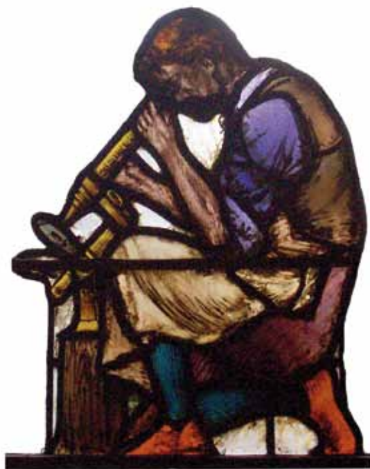
Savant au microscope, vitrail anonyme du bâtiment Tudor Chambers à Pretoria (1903-1904)

Aujourd'hui, un problème majeur lié à la pollution par les plastiques est leur diversité chimique [48]. Les composés utilisés dans la production de plastiques se comptent en milliers de molécules, dont quelques pourcents seulement font l'objet de suivis réglementaires [49]. Au final, ce sont des milliers de produits chimiques potentiellement toxiques pour les écosystèmes qui sont présents dans les plastiques conventionnels [50] et les plastiques biosourcés et biodégradables [12]. Parmi les additifs ajoutés intentionnellement, les phtalates, utilisés pour accroître la souplesse des plastiques, les bisphénols qui renforcent leur résistance, ou certains retardateurs de flamme sont des perturbateurs endocriniens connus [51,52]. Aujourd'hui, la composition des plastiques est protégée par le secret industriel. Les connais-