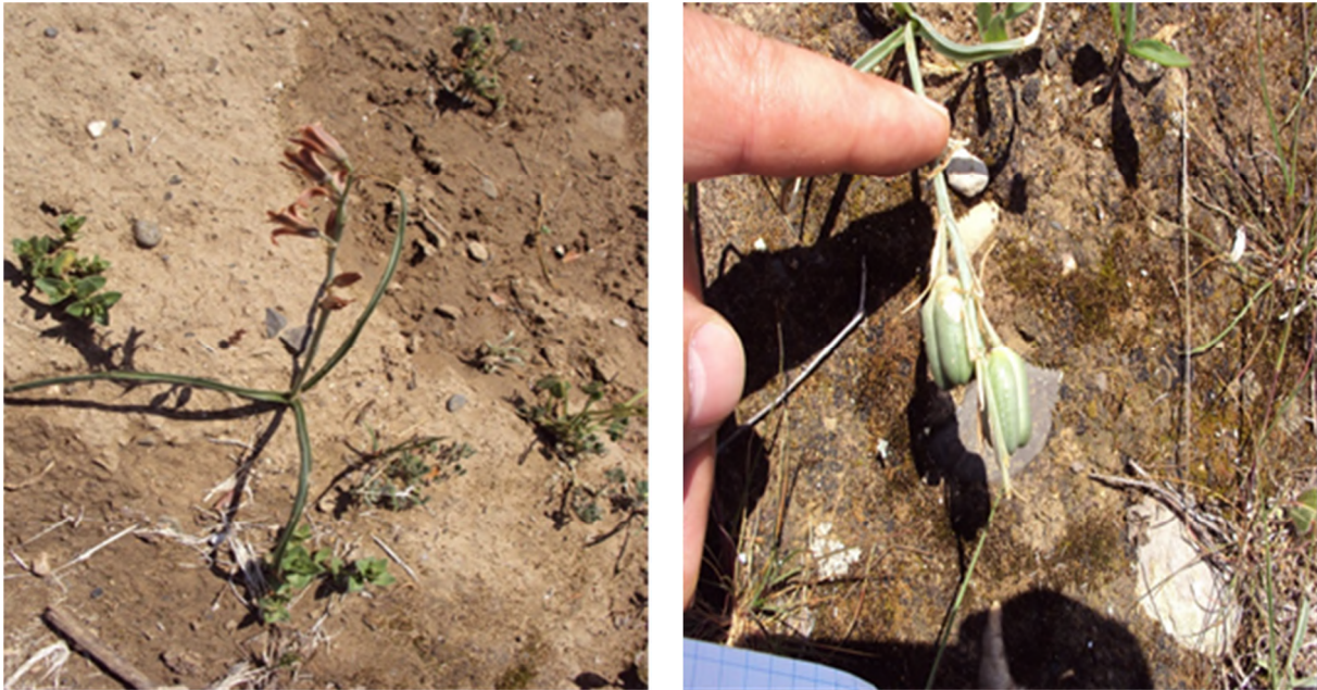
Figure 2 : Dipsadi serotinum (L.) Medik., récolté en fleur et en fruit, le 6 avril 2020 à Ath Vouali, Oued Sahel.

* Astragalus armatus subsp. numidicus (Coss. & Durieu ex Murb.) Tietz ; * Ebenus pinnata Aiton ; * Echinops spinosus subsp. bovei (Boiss.) Maire ; Eryngium campestre L. ; Ferulago lutea (Poir.) Grande ; Datura stramonium L. subsp. stramonium . ; Lobularia maritima (L.) Desv. subsp. maritima ; Lysimachia arvensis (L.) U. Manns & Anderb. ; Marrubium alysson L. ; Marrubium vulgare L. ; * Moricandia suffruticosa (Desf.) Coss. & Durieu ; Phagnalon saxatile (L.) Cass. ; Plantago albicans L. ; Plantago lagopus L. ; Reichardia tingitana (L.) Roth ; Reseda alba L. ; Retama sphaerocarpa (L.) Boiss. ; Rosmarinus eriocalyx Jord. & Fourr. ; * Thymus ciliatus Desf. var. intermedius Batt.]