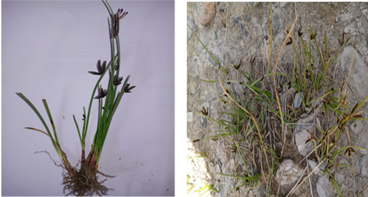
Figure 4 : Cyperus laevigatus subsp. distachyos (All.) Ball., photographié le 30 mars 2023 à El Asnam dans l'oued Zaiane (Photos R.Toumi).

individus ont été observés la première fois au niveau de la localité d'El Hachimia au sud de Bouira (3°56'47.93"E 36°14'15.65"N) à une altitude de 526 m, le 9 avril 2020, la deuxième observation compte plus de quinze individus, c'est un peu plus en aval, aux environs d'El Asnam (3°58'41.42"E 36°18'01.87"N), le 30 mars 2023 à 465 m d'altitude (Figure 4).