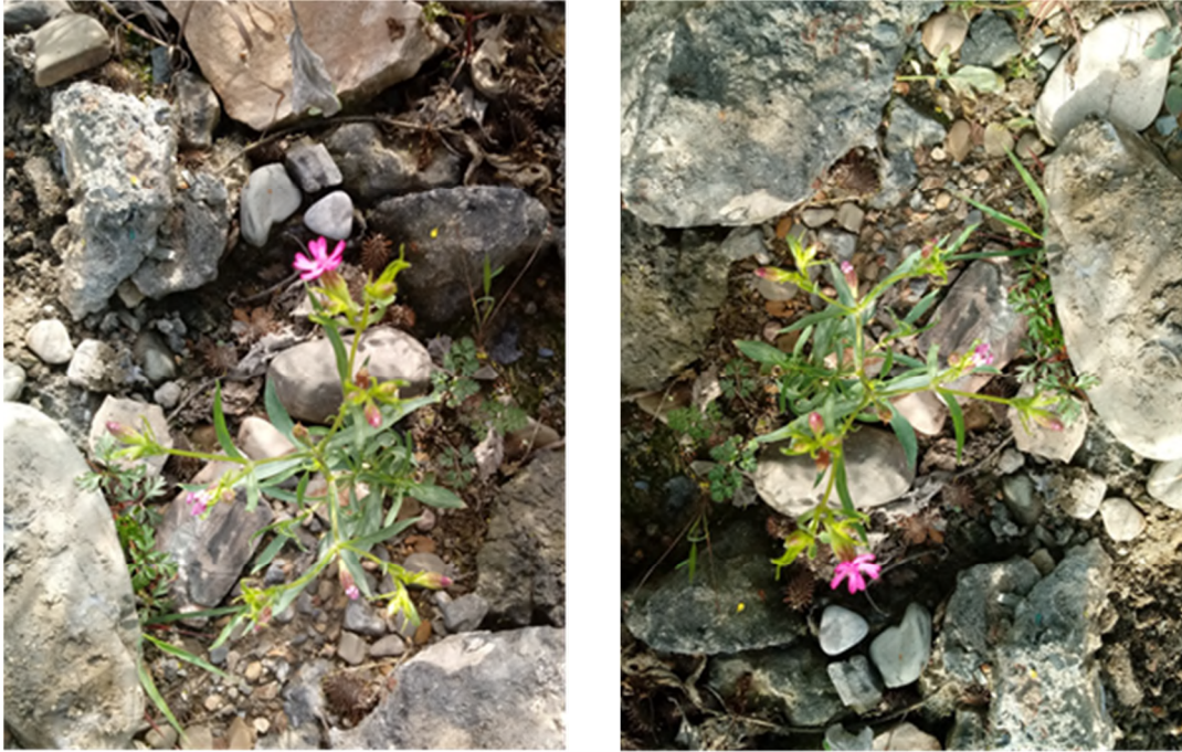
Figure 5 : Spécimen de Silene muscipula L. subsp. muscipula , recensé le 30 mars 2020 à Akbou le long de l'Oued Sahel.