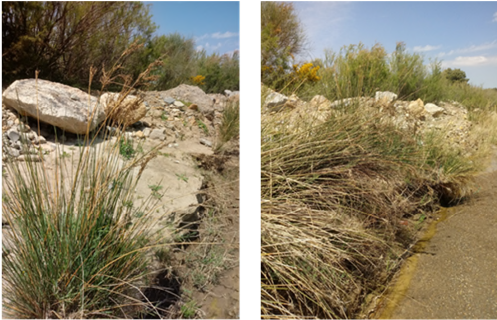
Figure 8 : Spécimen de Juncus subulatus Forssk, relevé le 09 avril 2020 à El Hachimia, sur la rive gauche de l'Oued Zaiane.

La plante se trouvait directement sur la berge du lit mineur des cours d'eau, elle est observée à l'Oued Sahel dans la localité d'Ahnif et dans plusieurs endroits dans l'un de ses affluents qui longeait les localités d'El Hchimia, El Asnam et d'EL Adjiba. Cette espèce a été observée dans six relevés avec plus de 25 individus. Elle a été recensée la première fois le 14 avril 2020 à Ahnif à une altitude de 317m (Figure 8), coordonnées 4°15'13.85"E, 36°20'25.13"N.