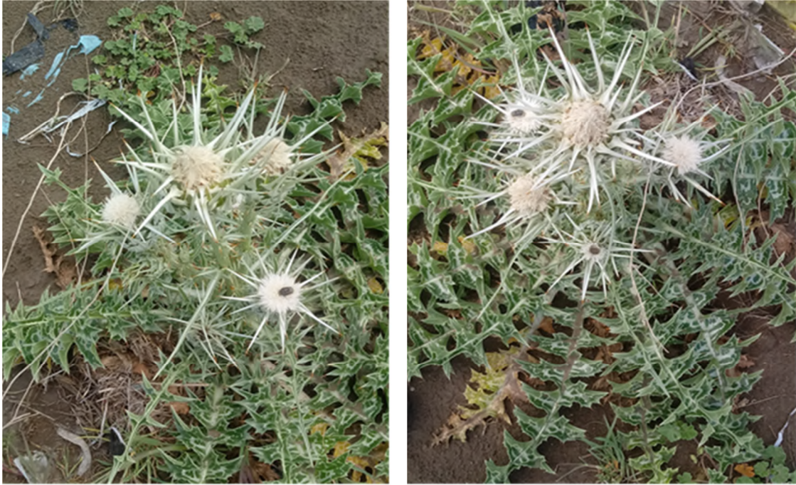
Figure 3 : Spécimen de Silybum eburneum Coss. & Durieu, relevé en mars 2020 à El Mehir sur l'Oued Azrou.

D'après Quézel & Santa (1962-1963), l'espèce est très commune dans la steppe, les pâturages sablonneux et les lieux un peu humides des Hautes Plaines, et de l'Atlas Saharien au sud. Munby (1866), Battandier (1890), et Quézel & Santa (1962-1963), n'ont pas mentionné ce taxon dans le Tell algérien. En outre, Letourneux (1893), Debeaux, (1894) et Meddour (2010) ne le donnent pas pour la Kabylie du Djurdjura. Une observation récente de l'un de nous (K. Rebbas, https://www.inaturalist.org/observations/65753497 ) plus au sud, confirme le col de Hammam Delaa comme un point de passage naturel vers la vallée aride des Portes de Fer (Bibans).