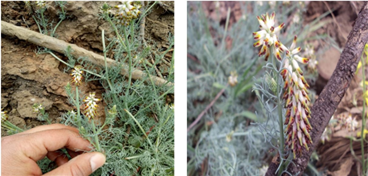
Figure 6 : Spécimen de Platycapnos tenuiloba Pomel subsp. tenuiloba , relevé le 20 avril 2020 à El Adjiba au bord de l'Oued Sahel (Photos Toumi, 2020).

Ce taxon a été observé dans un seul relevé avec trois individus, le 20 avril 2020 au niveau de la station d'El Adjiba (Oued Sahel) à 366 m d'altitude (4°09'48.49"E 36°19'53.64"N) (Figure 6). La plante se trouvait dans une clairière à la limite d'une ripisylve à Tamarix africana Poir. Sur le lit majeur de la rive gauche de l'Oued Sahel, non loin d'un champ agricole, en compagnie d'espèces suivantes : Conium maculatum L. ; Ferula communis L. ; Magydaris pastinacea (Lamk.) Paol. ; Smyrniolum olusatrum L. ; Silybum marianum (L.) Gaertn ; Centaurea calcitrapa L. ; Carduus pycnocephalus L. subsp. eu-pycnocephalus M. ; Sinapis alba L. subsp. alba Briq. ; Convolvulus arvensis L. ; Bryonia dioica Jacq. ; Geranium dissectum L. ; Malva sylvestris L. ; Plantago lanceolata L. subsp. lanceolata ; Hordeum murinum L. ; Polypogon monspeliensis (L.) Desf. ; Galium aparine L. ; Xanthium strumarium L. ; Cynoglossum creticum Mill. ; Echium austral Lam. ; Rumex crispus L. subsp. crispus ; Tamarix africana Poir.