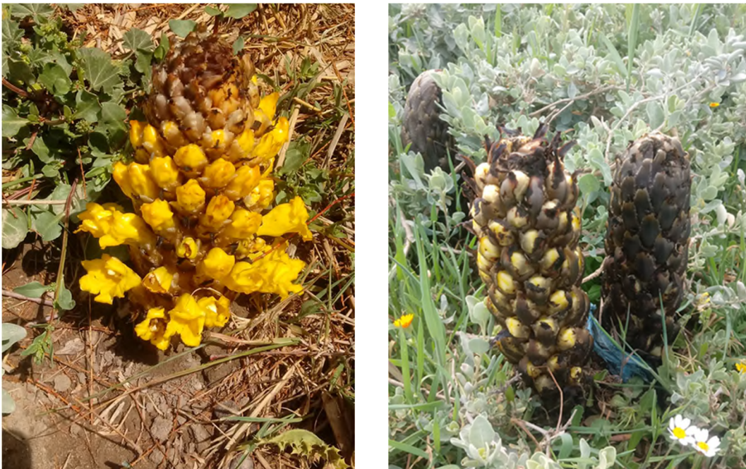
Figure 9 : Spécimen de Cistanche phelypaea (L.) Cout. sensu lato , relevé le 27 mars 2020 à El Mehir sur l'Oued Azrou.

Nous avons récolté ce taxon dans le même relevé que Silybum eburenium (voir relevé détaillé plus haut), au niveau de la localité d'El Mehir (Kabylie des Bibans), le 27 mars 2020 à 530 m d'altitude avec deux individus seulement sur une ripisylve à Tamarix africana Poir., coordonnées 4°22'23.67"E 36°07'41.35"N (Figure 9). La plante semblait parasiter la grande arroche ( Atriplex halimus L.).