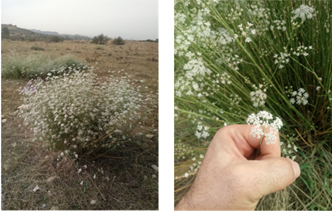
Figure 7 : Deverra scoparia Coss. & Durieu subsp. scoparia , récolté le 1er novembre 2022 à Ath Vouali dans l'Oued Sahel.

Pituranthos scoparius (Coss. et Dur.) Benth. & Hook subsp. scoparia se trouvait sur le lit majeur de l'Oued Sahel et sur quelques-uns de ses affluents, comme dans la partie amont de l'Oued Zaiane et le long de l'Oued Azrou. Le substrat est composé de sable grossier et de galets avec une végétation clairsemée, proche des formations steppiques, les espèces qui partagent cet habitat sont un mélange de plantes souvent d'affinité steppique* : Lobularia maritima (L.) Desv. subsp. maritima ; Scrophularia canina L. ; Datura stramonium L. subsp. stramonium ; Echinops bovei Boiss. ; Carthamus lanatus L. subsp. baeticus (B. et R.) M. ; * Rosmarinus eriocalyx Jord. ; * Retama sphaerocarpa (L.) Boiss. ; Tamarix africana Poir. ; Eryngium campestre L. ; * Artemisia herba-alba Asso ; Reichardia tingitana (L.) Roth ; * Ebenus pinnata Aiton ; Marrubium alysson L. ; Marrubium vulgare L. ; * Plantago albicans L. ; Reseda alba L. ; Reseda phyteuma L. subsp. phyteuma Maire.