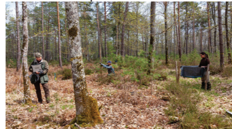
Divers relevés sur une placette mélangée de chêne sessile et de pin sylvestre du dispositif OPTMix.

satellites. A ces mesures et observations faites régulièrement, peuvent s'ajouter des suivis plus ponctuels, comme le stress hydrique des arbres, la respiration du sol ou du tapis de mousse.