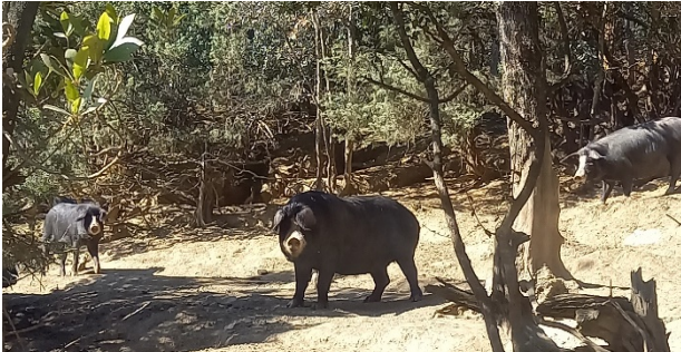
Figure 1 – Truie meneuse et sa bande

Cet accès aux parcours des charcutiers et des truies meneuses n'est possible que par l'acceptation d'une prise de risque les concernant notamment en été et automne.