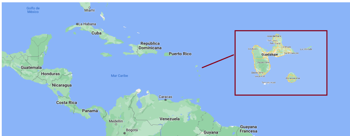
Figura 2. Localización geográfica de Guadalupe