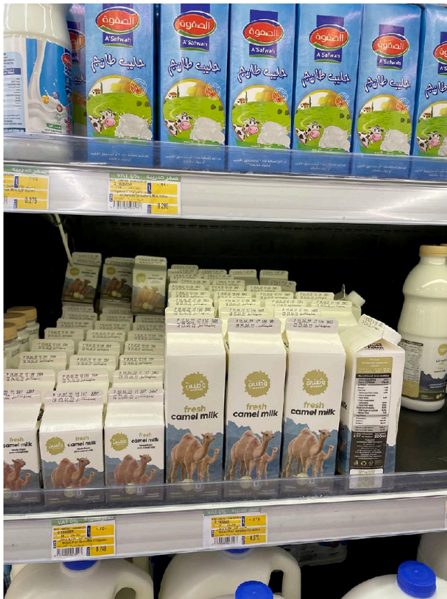
Figure 1 : Berlingots de lait de chamelle pasteurisé (un litre et un demi-litre) dans le linéaire « produits laitiers » du supermarché Carrefour à Salalah // Carton of pasteurized camel milk (one liter and half a liter) in the “dairy products” section of the Carrefour supermarket in Salalah

Ainsi, et même si cette « marchandisation » du lait de chamelle (Faye, 2019) apparaît particulièrement récente dans la région et qu'elle ne concerne qu'une petite partie du lait disponible localement, le processus interroge tant sur le plan conceptuel que pratique. Autrement dit, comment est-on passé en quelques années d'une « économie du don », à une « économie marchande » ? Avant de tenter d'apporter diverses réponses, il convient de revenir sur les concepts théoriques qui sous-tendent la compréhension de ce passage.