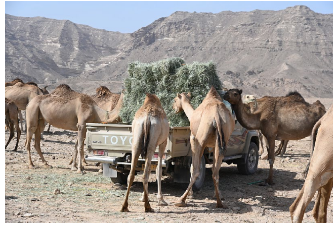
Figure 2 : Distribution de Chloris gayana (herbe de Rhodes) provenant de cultures irriguées à un troupeau de chameaux dans le Dhofar, Oman /// Distribution of Chloris gayana (Rhodes grass) from irrigated crops to a herd of camels in Dhofar, Oman

Cependant, une telle configuration est entrée en crise dès les années 1990. Bien que sédentarisés pour la plupart, les ex-nomades n'ont pas abandonné leurs chameaux et même, grâce aux revenus tirés des activités dans le secteur public ou privé, ont accru leur cheptel : entre 2004 et 2019, la population cameline du Dhofar est passée de 54 à 165 milliers de têtes. Or, avec la pression foncière en lien avec la sédentarisation, l'urbanisation et le développement du tourisme, et surtout l'augmentation considérable des effectifs animaux, les ressources naturelles ont cessé de couvrir les besoins des animaux (pas seulement les camelins). L'augmentation de la charge animale a contribué au surpâturage et à la détérioration des ressources pastorales, forçant les éleveurs à acheter des fourrages irrigués (essentiellement de l'herbe de Rhodes – Chloris gayana – produite dans les zones désertiques de la région de Wubar, au nord du Dhofar) et divers concentrés du commerce produits localement ou importés pour couvrir les besoins du cheptel. Dès lors, les éleveurs sont devenus dépendants de commodités renchérissant considérablement leurs coûts de production (figure 2).