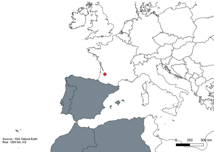
Figure 2.- Carte de répartition de Sintula furcifer (nouvelle localité en rouge).