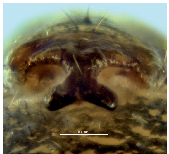
Figure 5.- Epigyne en vue postéro-ventrale (Coll. Guerbaa, Ciron 2022).