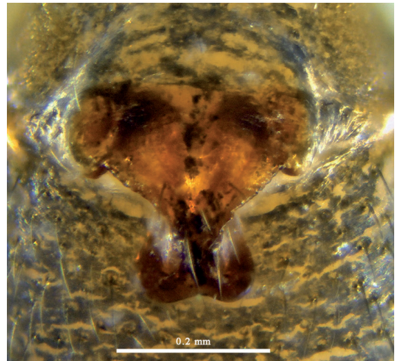
Figure 4.- Epigyne en vue ventrale (Coll. Guerbaa, Ciron 2022).