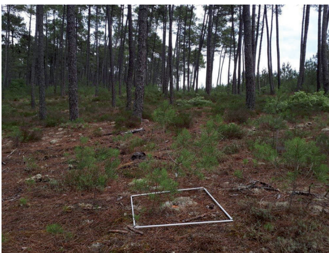
Figure 8.- Habitat du site de capture.