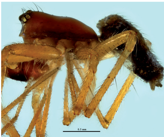
Figure 7.- Habitus du mâle (Coll. Guerbaa, Ciron 2022).