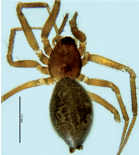
Figure 6.- Habitus de la femelle (Coll. Guerbaa, Ciron 2022 ; photo : P. Oger).