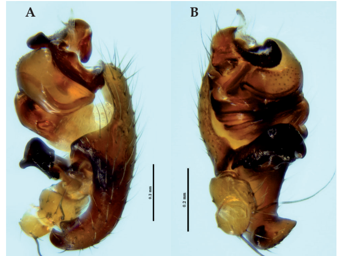
Figure 3.- Pédipalpe du mâle : A, vue rétro-latérale ; B, vue ventro-prolatérale (Coll. Guerbaa, Ciron 2022).

Cette espèce est connue pour habiter les régions sub-humides, fréquentant les broussailles, les maquis et les forêts plutôt sèches (BOSMANS, 1991). Le secteur où les individus ont été capturés est constitué d'une futaie régulière de Pins maritimes âgés (entre 40 et 60 ans) issue d'une régénération naturelle (fig. 8). Les individus ont été capturés en mars pour les mâles et en avril pour la femelle. Le sous-bois est relativement dégagé et la litière est constituée d'aiguilles de pins et de lichens. Cet habitat semble correspondre aux forêts sèches évoquées plus haut.