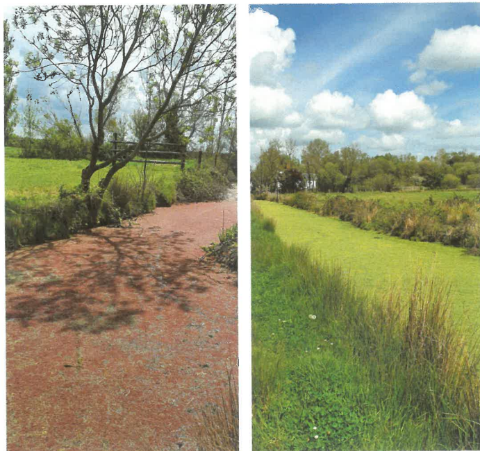
Figure 1 – L'Azolla (à gauche) et les Lentilles d'eau (à droite) dans des canaux de la ferme expérimentale - 20 avril 2022 (©A. Riche / INRAE).