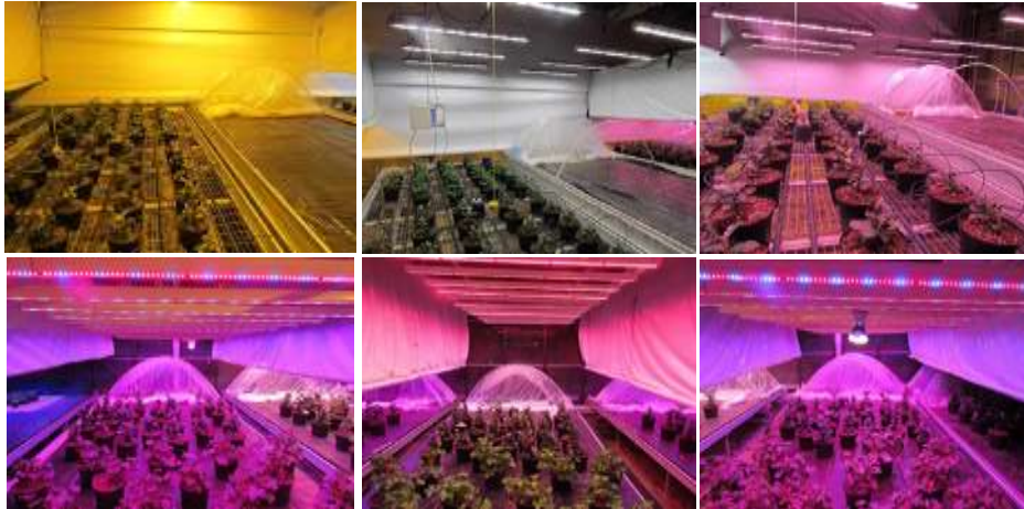
Figure 1 : Six systèmes d'éclairage photosynthétique évalués au sein d'ASTREDHOR Loire-Bretagne (Stepp) émettant différentes couleurs de lumière à intensité équivalente ( 70 \mu\text{mol}/\text{m}^2/\text{s} ) sur cultures de multiplication de Pélargonium et de Dipladénia. De g à d et de h. en b. : éclairage classique à haute pression sodium (HPS), LED VALOYA NS1, LED VALOYA AP67, PHILIPS DR/B 150, PHILIPS DR/W 150 et PHILIPS DR/W 150 + SPOT FR

Depuis l'automne 2014, différentes installations d'éclairage LED sont évaluées dans trois stations d'ASTREDHOR (ex. Stepp, Figures 1 et 2). Les premiers travaux montrent des perspectives prometteuses pour contrôler la croissance et l'architecture du jeune plant et pour stimuler le développement racinaire en fonction du spectre lumineux utilisé. Il est donc possible de façonner les jeunes plants destinés à la production florale selon les besoins des horticulteurs, mais les effets à long terme (quand la plante fleurie arrive au stade de commercialisation) sont encore inconnus.