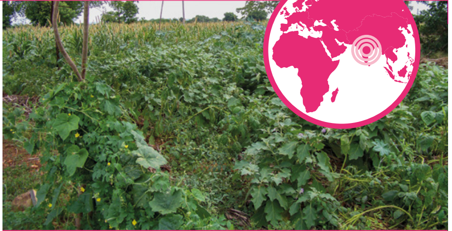
Jardin potager en natural farming.