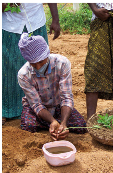
Application de biostimulant liquide sur un plant de papaye.

d'importantes inégalités et une pauvreté qui demeure immense. D'après les données du recensement, les ouvriers agricoles sans terre, ou disposant de trop peu de terres pour en tirer l'essentiel de leur revenu, représentaient 142 millions de personnes en 2011, soit plus de la moitié des actifs agricoles de l'Inde. Leur place dans le natural farming se résume-t-elle à la mise en place de micro jardins attenants à leur habitation ou peuvent-ils profiter d'opportunités d'emploi accrues chez les agriculteurs patronaux qui feraient du natural farming ? Pour quelle rémunération? Les observations indiquent que les natural farmers mobilisent surtout la main-d'œuvre familiale pour élaborer et épandre les préparations ZBNF. Comment assurer un partage de la valeur entre patrons et salariés qui soit plus équitable que dans l'agriculture conventionnelle?