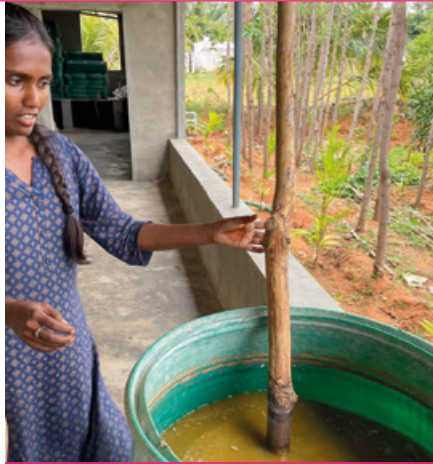
Préparation de biostimulant à base d'urine.