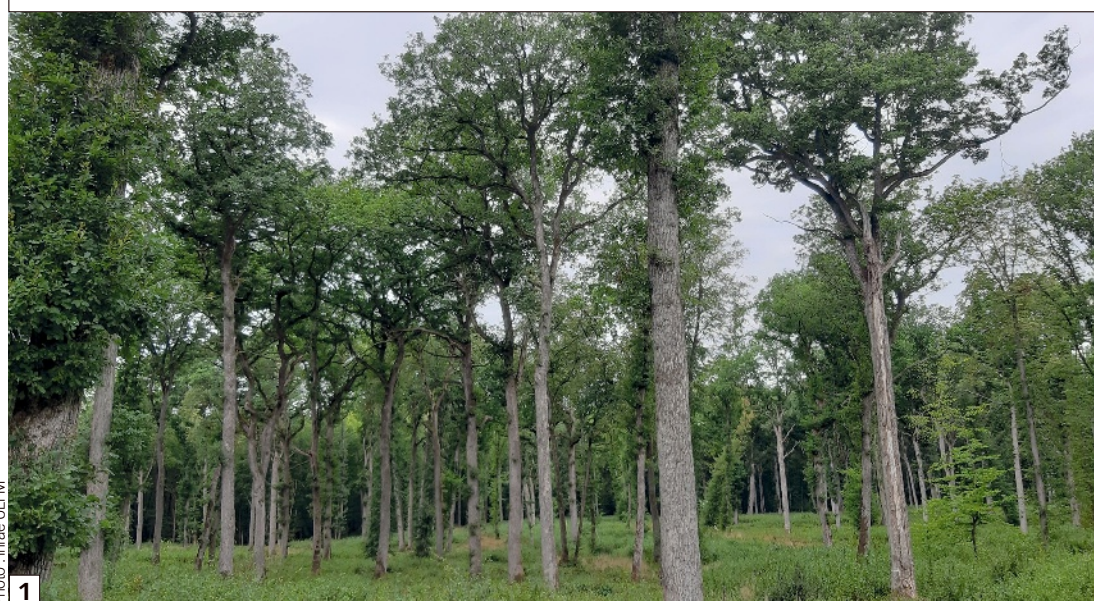
Chênes présents sur le site de Champenoux.

ANNE-SOPHIE BRINQUIN (1) , CHRISTOPHE BAILLY (2) , FLORENT BARBIER (1) , CÉLINE BARTHET (3) ET SÉBASTIEN BIGA (3) (1) Inrae - Unité expérimentale entomologie et forêt méditerranéenne - Avignon. (2) Inrae - UMR Interactions arbres micro-organismes - Champenoux. (3) Sumi Agro France - Paris