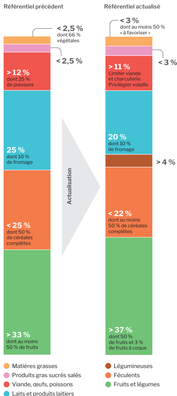
Figure 1. Répartition conseillée des groupes d'aliments en pourcentage du poids total (et des catégories d'aliments en pourcentage du poids de leur groupe)

Notes de lecture : la répartition concerne le poids des aliments tels que consommés (par exemple des pâtes cuites, et non pas des pâtes sèches, ou une banane épluchée, et non pas une banane avec sa peau). Matières grasses « à favoriser » : huiles de colza, d'olive et de noix. La catégorie poissons inclut l'ensemble des produits de la pêche et de la pisciculture.