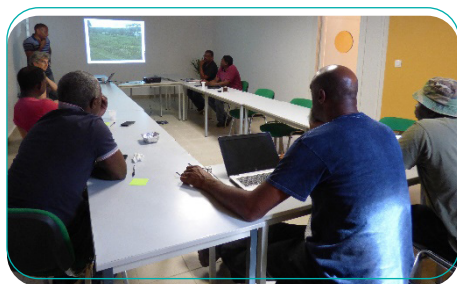
Ateliers participatifs

Plusieurs de ces pratiques permettant d'améliorer les performances agronomiques, économiques et environnementales sont testées au sein de la mini-ferme. Elles sont issues de savoirs paysans et d'innovations proposées par la recherche.