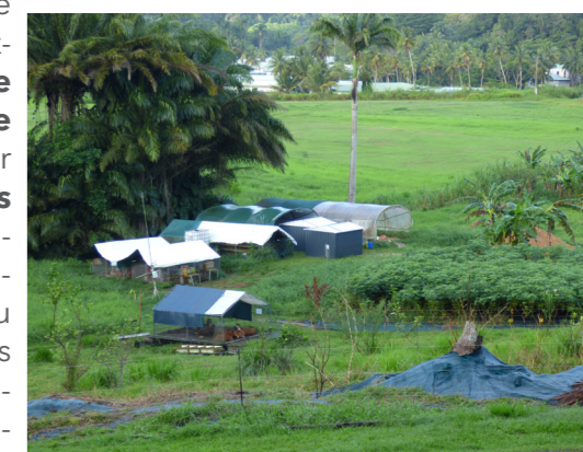
Vue d'ensemble de Kréyol'Inov en mai 2023