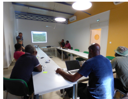
Ateliers participatifs