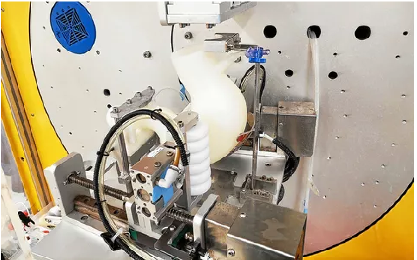
Le laboratoire STLO dispose d'une machine reproduisant une partie du système digestif humain.

Lancé en 2020, Prolific arrivera à son terme fin 2025. Ses résultats seront alors mis à disposition des industriels, qui décideront ou non de poursuivre les recherches de leur côté, par exemple pour mettre au point de nouveaux produits. Car si Prolific est un projet scientifique, il y a, derrière, de vrais enjeux commerciaux. « Développer des produits fonctionnalisés pour la santé permettra, dans des segments où la concurrence est forte, de créer de la valeur et d'aller chercher des positions à l'export, indique Bba Milk Valley, sur son site internet . C'est un enjeu pour la filière laitière de l'Ouest qui repose sur un modèle PGC (produits de grande consommation) qui ne permet plus de rémunérer correctement le lait. »