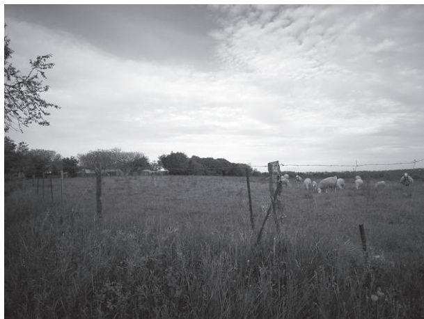
Fig. 2. Le terrain clôturé de Pierre sur lequel pâturent des brebis appartenant à un habitant des caravanes que l'on devine en arrière-plan. Commune à l'ouest de Montpellier (source : Charles Lugiéry, mai 2022).

un peu comme ça. Avant, ils sortaient beaucoup à droite à gauche, ils viennent là parce que c'est clôturé, c'est beaucoup plus pratique 42 .