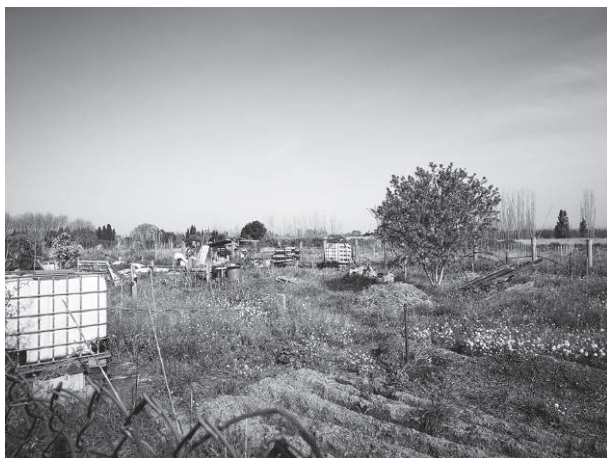
Fig. 1. Potager cultivé par des Gitans selon l'agent municipal d'une commune périurbaine au nord de Perpignan (source : Charles Lugiéry, 2022).

cabanisation. Ces exemples nous donnent à voir différentes composantes des interstices. Ceux-ci se présentent comme des lieux à la fois délaissés et convoités. Ils se révèlent comme des entre-deux : entre deux lieux, mais aussi parfois entre deux temps 39 . L'enfrichement des espaces agricoles, lié à la déprise agricole et à des stratégies de spéculation foncière, produit un paysage d'entre-deux-temps : le temps de la production agricole et celui d'une future urbanisation potentielle. Dans cet intervalle, la friche devient un espace convoité pour des pratiques interstitielles.