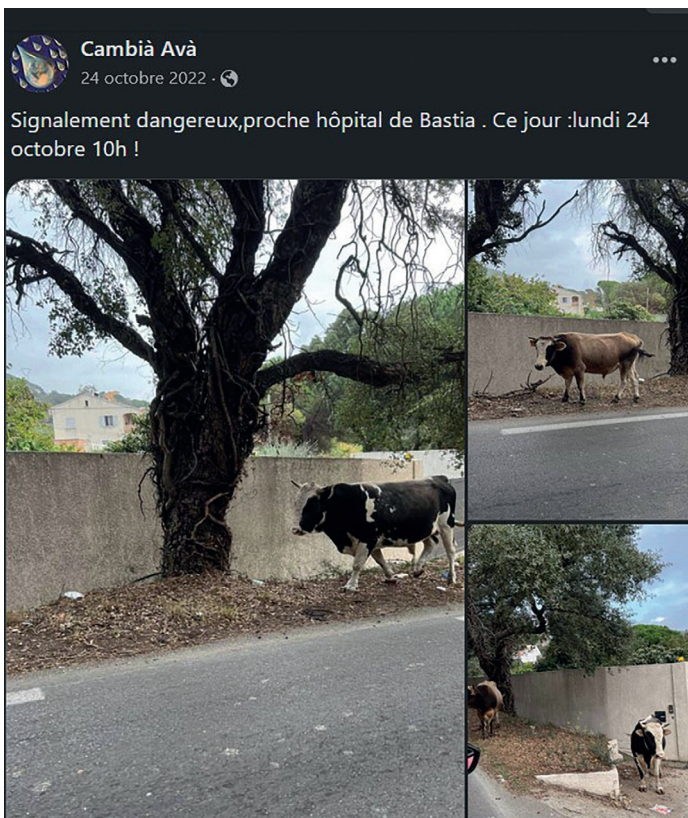
Figures 3 et 4: Publications de l'association Cambià Avà sur Facebook.