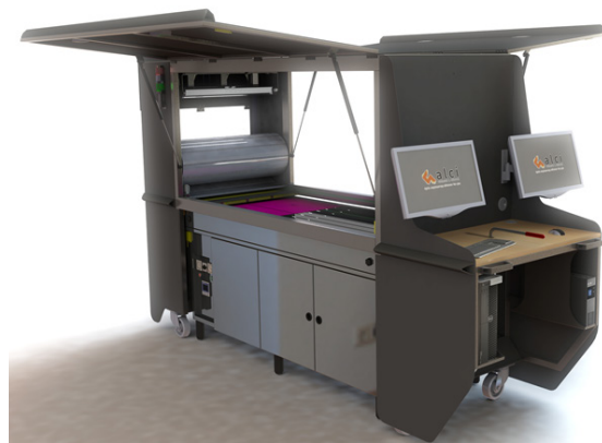
Figure 2. Automate de germination

• Le plateau de phénotypage des semences regroupe, aux côtés d'équipements éprouvés (compteurs de grains, loupes binoculaires, balances, tamis ...), des équipements novateurs et des prototypes développés spécifiquement pour ce plateau. Ces matériels permettent de mesurer et de caractériser les graines sèches (morphométrie), leur qualité biochimique (composition chimique, structure physique) et leur faculté germinative. L'idée qui prévalait autour de la mise en place de ce plateau était d'utiliser des techniques nouvelles, comme la robotisation, l'analyse automatique d'images et la spectrométrie proche infra-rouge. Ces technologies, déjà largement éprouvées dans d'autres secteurs, permettent des gains importants de productivité, de fiabilité et de qualité des données obtenues. Sont notamment présents sur ce plateau : un banc automatique de suivi et de caractérisation de la dynamique de la germination des semences par analyse d'images ; trois appareils de mesure des semences par analyse d'images permettant d'accéder à la valeur moyenne des lots, mais aussi à leur variance ; deux trieurs expérimentaux de laboratoire, l'un sur la base de la forme et de la couleur des graines, le