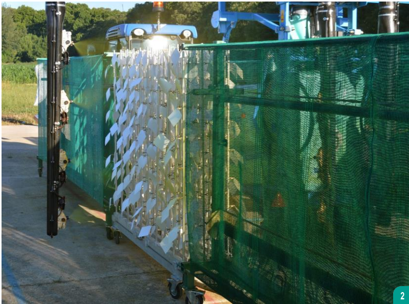
Entre 2014 et 2018, des dizaines de machines de différentes typologies (face par face, voûtes, aéroconvecteurs...) ont été testées sur EvaSprayViti selon la méthodologie développée par l'IFV et Inrae.

( face par face, voûtes, aéroconvecteurs...) ont été testées sur EvaSprayViti selon la méthodologie développée par l'IFV et Inrae (Cheraïet et al. , 2024). Ces essais ont permis d'identifier des différences significatives entre les pulvérisateurs et de valider l'intérêt de construire une classification. Les tests ont été réalisés en collaboration avec les fabricants de pulvérisateurs, avec le soutien des chambres d'agriculture locales et du Comité interprofessionnel du vin de Champagne (CIVC). En 2018, l'IFV et Inrae ont acquis suffisamment de références pour définir une méthode de classification des pulvérisateurs