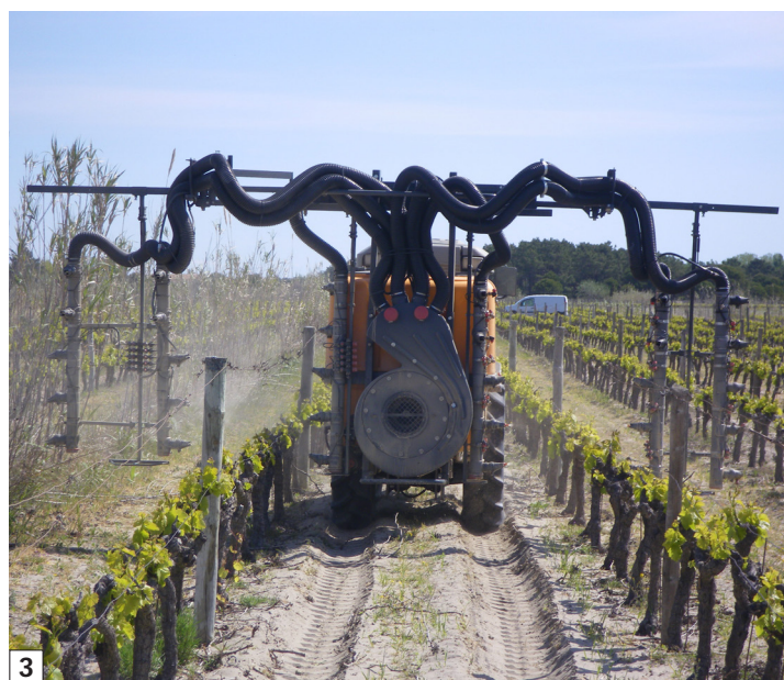
Traitement de la vigne avec des LWA très contrastées : pleine végétation (photo 2) et début de végétation (photo 3).