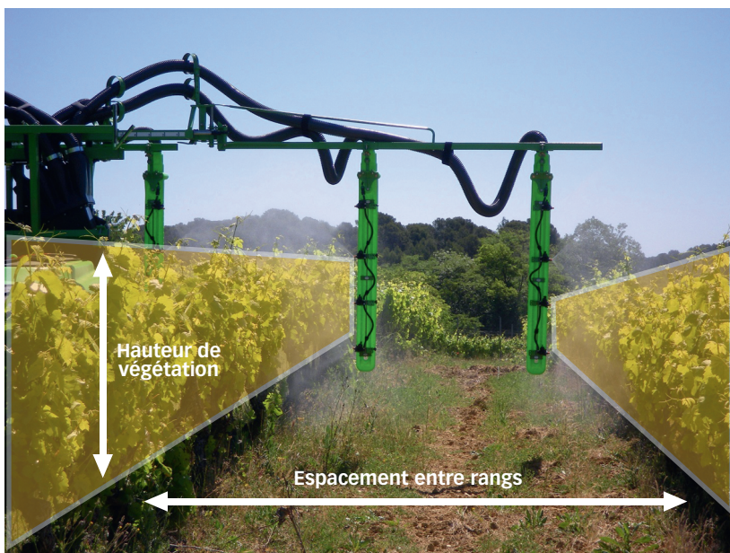
Fig. 1 : Surface de haie foliaire (LWA, Leaf Wall Area)

Le workshop intitulé « Harmonized dose expression for the zonal evaluation of plant protection products in high growing crops » organisé en 2016 par l'EPPPO (European Plant Protection Organization) a été décisif et a permis de trouver un consensus entre les différents acteurs (firmes phytosanitaires, prestataires réalisateurs d'essais, instituts techniques, agences d'évaluation) et les différents pays. Le but de ce workshop était d'harmoniser la façon dont les essais d'efficacité sont conduits dans les différents pays depuis la mise en place de l'évaluation zonale des produits en 2011. En effet, les agences d'évaluation, et également les sociétés (firmes phytopharmaceutiques ou prestataires) qui montent les dossiers, sont souvent confrontées à la difficulté de comparer des résultats d'essais qui sont conduits au niveau de chaque pays dans