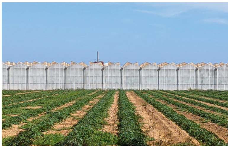
Photo 2 – Dans ces serres chauffées (cheminée de la chaudière visible en arrière-plan) qui se multiplient sur le territoire, des légumes d'été, des agrumes et arbres tropicaux sont cultivés.

D'autres exploitants adoptent une stratégie « adaptative » qui contribue à garantir la rentabilité économique de leur activité en transformant ou en ajustant le fonctionnement de leur exploitation à une nouvelle réalité hydrologique. Par exemple, un viticulteur perfectionne ses techniques de greffe afin de rendre les ceps plus résistants au manque d'eau, tout en adoptant une stratégie commerciale offensive afin d'assurer ses ventes via sa cave particulière. Un autre arboriculteur choisit de transformer profondément son exploitation. Il a quitté la coopérative fruitière, a remplacé ses pêchers par des oliviers,