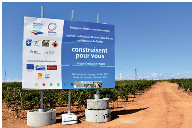
Photo 1 – Projet d'irrigation de la vigne à Pézilla-la-Rivière.