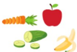
FRUITS ET LÉGUMES cru ou cuit