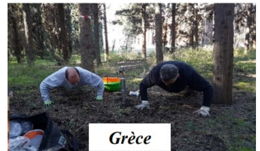
Échauffement avant échantillonnage avec un collègue grec