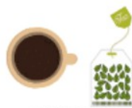
MARC DE CAFE ET THE