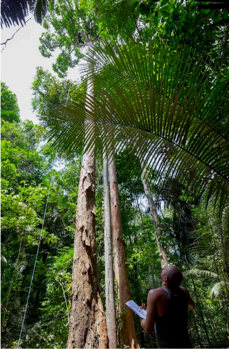
Sélection des branches à échantillonner dans la couronne du Grignon franc.

La première hypothèse, qui est relativement intuitive, est que les arbres de par leur besoin en lumière pour la photosynthèse sont exposés aux UVs. Une hypothèse forte est que les UVs sont un agent mutagène important des plantes, à l'image de ce qui est déjà bien décrit de l'impact des UVs sur les cellules de la peau humaine .