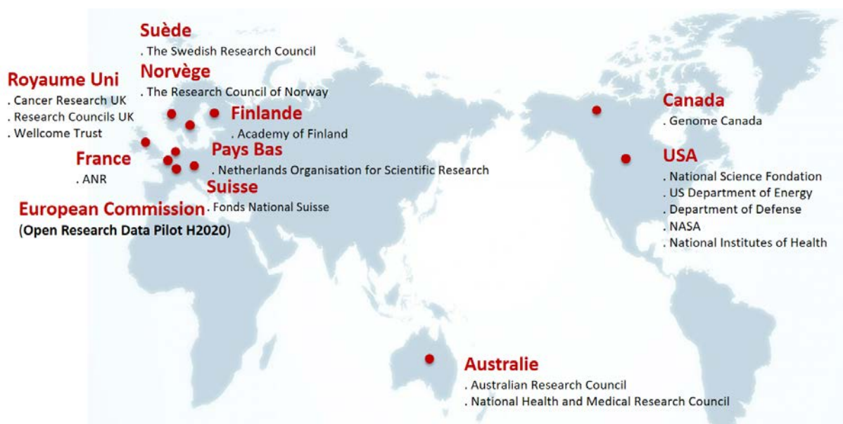
Figure 1. Financeurs de la recherche exigeant un plan de gestion des données (S. Cocaud, 2019)

A partir des années 2000, l'explosion du volume de données produites et les bénéfices potentiels de l'open data incitent les financeurs à recommander aux porteurs de projets d'accompagner leur demande de financement d'un plan de gestion des données. La National Science Foundation (US NSF) est ainsi le premier financeur à demander à ce qu'un plan de gestion des données qui seront préservées sur le long terme soit fourni avec la demande de financement d'un projet : "The NSF should require that research proposals for activities that will generate digital data, especially long-lived data, should state such intentions in the proposal so that peer reviewers can evaluate a proposed data management plan" (National Science Foundation, 2005). Cette recommandation deviendra une exigence pour tous les projets financés par la NSF à partir de 2011. La NSF a été rapidement suivie dans cette démarche par les organismes de financement de la recherche au Royaume-Uni, pour s'étendre à des pays de plus en plus nombreux (figure 1).