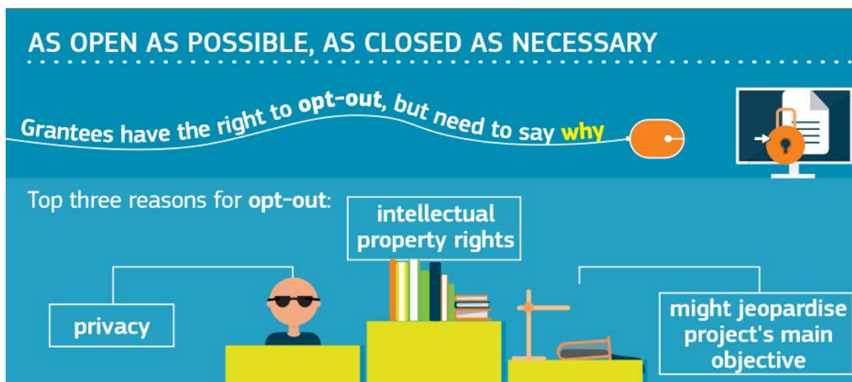
Figure 3. Infographie résumant la politique "Open Data" de la commission européenne (extrait de : Open research data in Horizon2020 12 )

Depuis 2017, les projets financés par la Commission Européenne dans le cadre du programme Horizon 2020 participent par défaut à l'action pilote "libre accès aux données de la recherche" qui vise à rendre accessible au plus grand nombre les données de recherche générées par ces projets. Les responsables des projets doivent rédiger un PGD indiquant les données qui seront librement accessibles à l'issue du projet (à minima les données et métadonnées nécessaires à la validation des publications), toute exception à l'ouverture des données devant être justifiée. La phrase « as open as possible, as closed as necessary » résume clairement la politique européenne en matière d'open data.