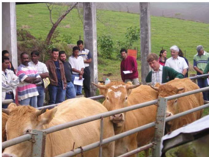
Photo 1 : journée d'animation organisée par l'EDE 3 chez un éleveur du référentiel

Si les partenaires de l'élevage sont globalement les mêmes que ceux que l'on rencontre en France métropolitaine, il y a également des spécificités liées à la petite dimension du territoire. Ainsi, en élevage bovin, les coopératives rassemblent la majorité des éleveurs. La SicaRévia (SICA Réunion Viande), qui est le principal partenaire dans le travail qui est exposé ici, représente 85% des parts de marché du gros bovin.