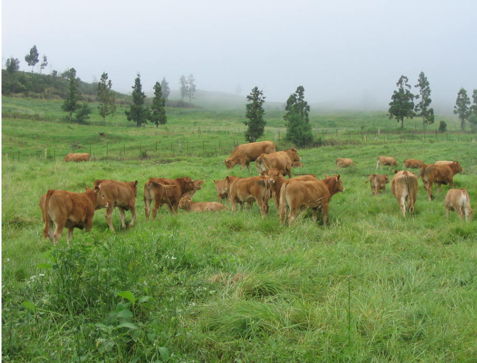
Photo 2 : élevage naisseur suivi dans les Hauts de l'Ouest