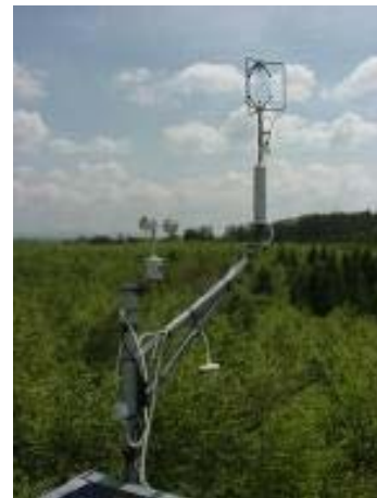
Photo 4 : Anémomètre à coupelles (en bas), et anémomètre sonique au sommet de la tour