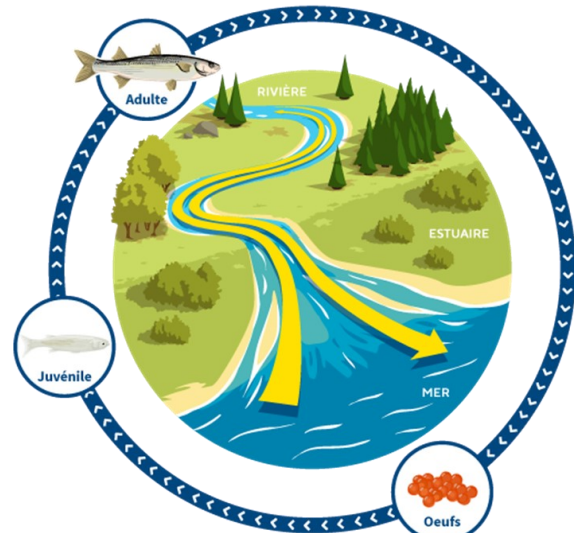
Cycle de vie schématisé du mullet porc Chelon ramada

Les connaissances concernant de nombreux traits de vie du mullet porc, tels que le sex ratio, l'âge à la première reproduction, les périodes de reproduction, le calendrier des migrations ainsi que le régime alimentaire, sont très partielles, souvent anciennes et n'existent que pour quelques localisations. Il est crucial de compléter ou mettre à jour ces données à travers des études couvrant une plus grande diversité de régions et en utilisant des méthodes actuelles pour obtenir une vision à la fois plus globale mais aussi plus précise, des caractéristiques biologiques et écologiques de ces espèces sur le territoire métropolitain.