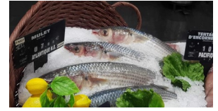
Mullets en vente à l'étal de poissonneries