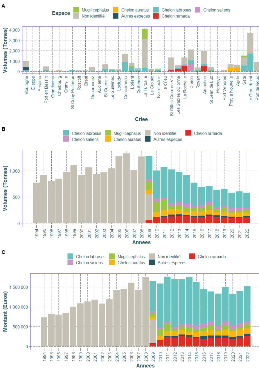
Volumes de mullets vendus par criée (A), par année (B) et montant en euros (C) pour les différentes espèces (VISIONET/France Agri-mer)